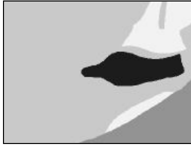
Obr.3. Vyjádření pásma přechodu pomocí ostré množiny