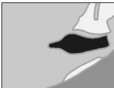
Obr.1. Vyjádření pásma přechodu pomocí hraniční linie