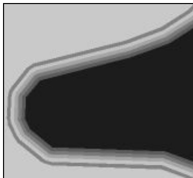
Obr.4. Vyjádření pásma přechodu pomocí neostré množiny