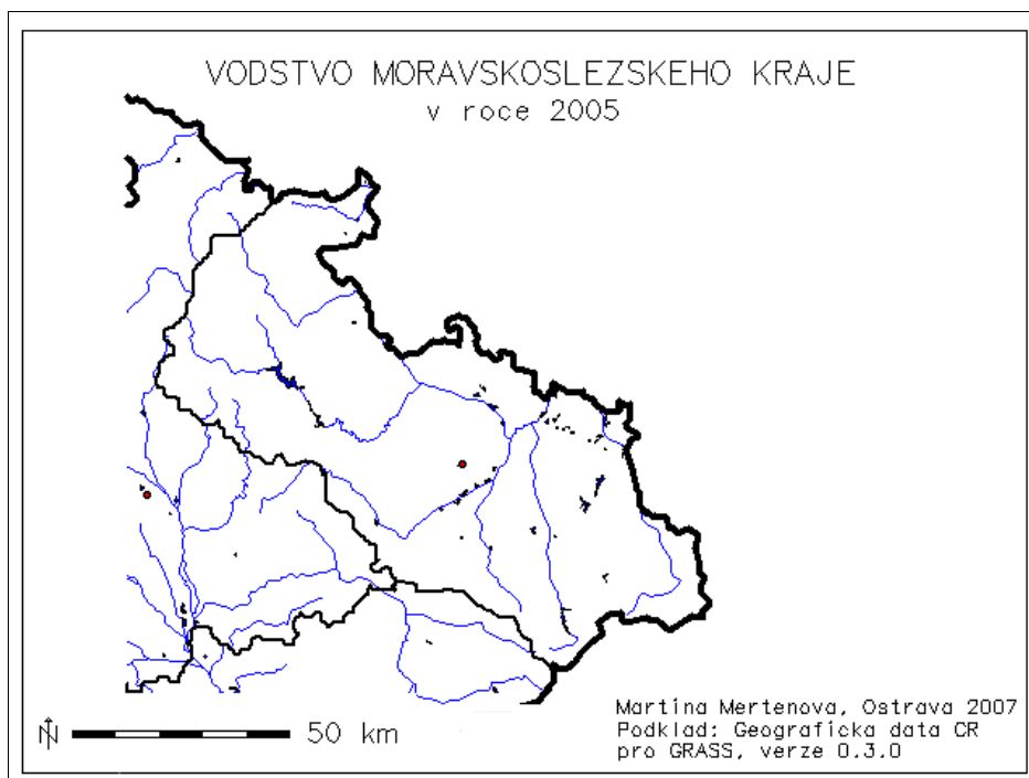
Obrázek 3 - GRASS - ukázka tematické mapy